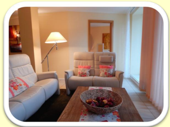
Fewo Göteborg, 5 Sterne