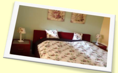
Ferienwohnungen in der Fasanenstraße 13a,b,c in Otterndorf