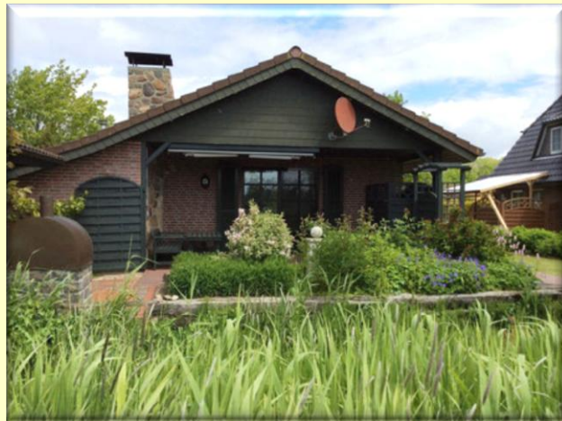
Ferienhaus Nils Holgersson Ferienpark Achtern Diek, Am Priel 12

Auch für Radfahrer bietet Otterndorf eine abwechslungsreiche Möglichkeit an Wegen an. In der Stadt gibt es eine Vielzahl an Restaurants, um sich verwöhnen zu lassen. Oder Sie genießen einen Cappuccino mit Torte oder Eis direkt am Kirchplatz. Anschließend schlendern Sie durch die historische Altstadt.